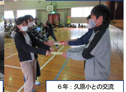
6年：久原小との交流