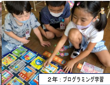
2年：プログラミング学習