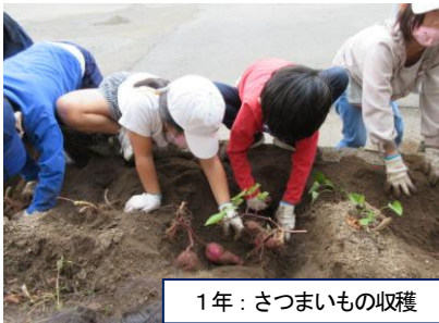
1年：さつまいもの収穫

2学期も、いよいよ12月を残すのみとなりました。新型コロナウイルス感染拡大防止対策を続けながら、2学期の学習や生活のまとめをしていきたいと思っています。気温の低い日が増えていくことが予想されますので、引き続き、お子さんの健康管理をよろしくお願ひいたします。