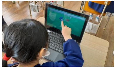
【Chromebook を使って学習中のつき組さん】

隣接する立花幼稚園とは、日頃から、給食や本の貸し出し等、定期的な交流を続けています。11月17日（水）には、立花幼稚園つき組（年長）の子ども達が、本校の教室で、Chromebookを使った学習に挑戦しました。離れた場所にいる人とChromebookを使って話をしたり、知育ゲーム&アプリを使って頭や身体の体操をしたり・・・子ども達は、終始笑顔で、楽しそうに学習に取り組んでいました。