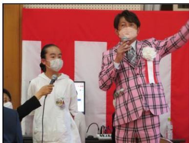
質問コーナー「教えて先輩！」

学校同様に、立花っ子のみんなも、未来に向けてさらに飛躍できることを願っています。