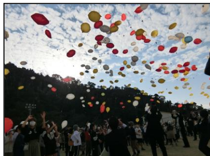
未来へむけて！バルーンリリース