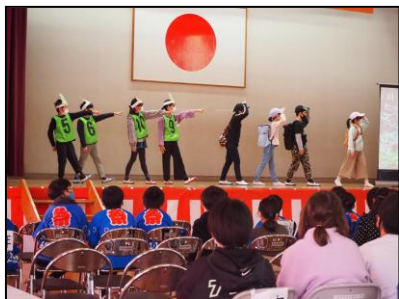
4年：立花の森と水と私たち