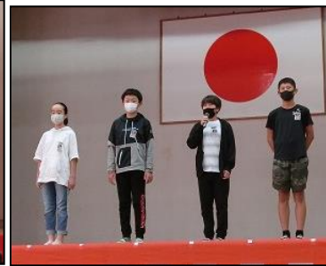
6年：私たちの立花のPR活動