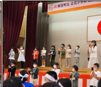
3年：ふるさと立花クイズ