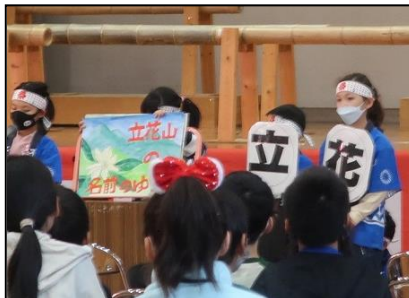
2年：竹太鼓・たちばなの由来