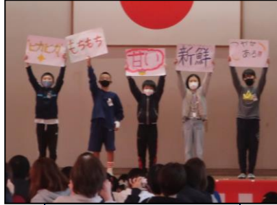
5年：立花の米作りを学ぼう