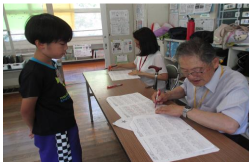
【チャレンジ学習の様子】

いよいよ、明日から夏休みがスタートします。病気や怪我をしないで元気に過ごすことはもちろんですが、事件や事故に巻き込まれないように十分気を付けて生活してほしいと思っています。