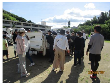
【学校での廃品回収の様子】