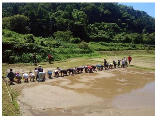
【立花口での田植えの様子】

立花小学校の子どもたちは、幸せ者です。 地域に愛される立花小。 地域の皆様、ありがとうございます。